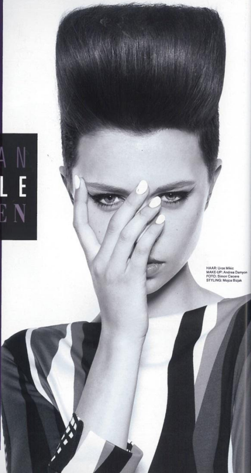
HAAR: Ura Miki MAKE-UP: Andrea Dampson STYLING: Moja Biagak

Sie sind die Königinnen des Styles. Lassig, elegant und vor allem extrem feminin. Vielschichtig und changierend sind die Haarfarben. Die Looks unterstreichen die Persönlichkeit der dynamischen Femme fatale und zeigen sich in Gegensätzen – große Locken, raffinierte Up-Dos und wilde Bobs. Urban Styles eben, die das pulsierende Leben der Großstadt widerspiegeln, mit ihren unzähligen Facetten.